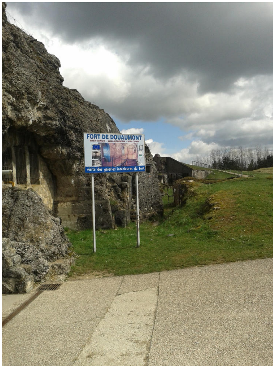
Vchod do pevnosti Douaumont