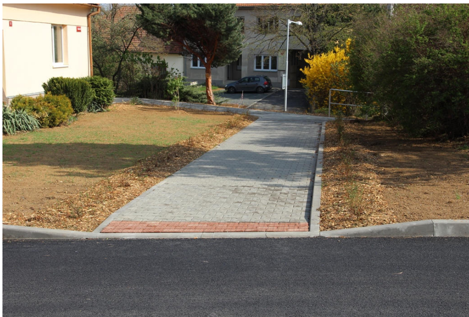
Upravené prostranství od kostela Všech svatých k chodníku na ulici Pavlíkova