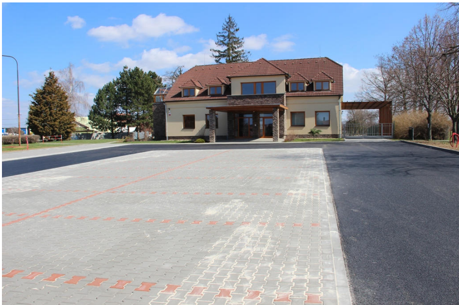
Upravené prostranství před zdravotním střediskem