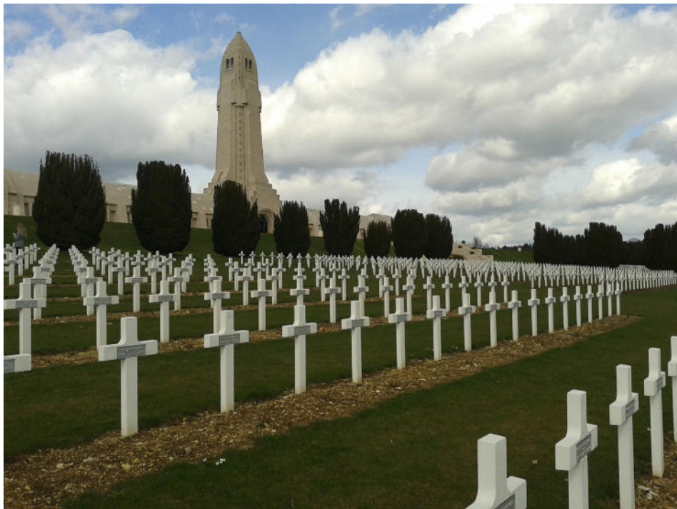
Památník a tisíce křížů těch, kteří byli identifikováni