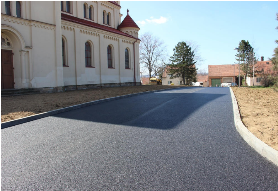
Upravené prostranství u kostela Věch svatých